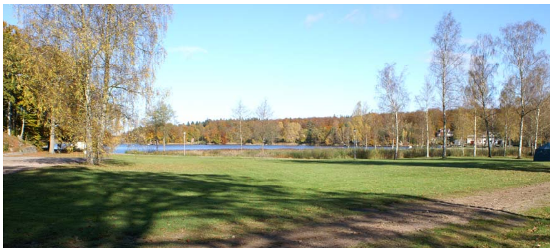
Friluftsområdet med vassbukten i bakgrunden sett från parkeringen vid kanotcentrat

Gällande miljökvalitetsnormer för luft, med gränsvärden för kväveoxid, kvävedioxid, svaveldioxid, kolmonoxid, bly och partiklar (PM10) i utomhusluft, bensen och ozon bedöms heller inte överskridas med en utbyggnad av området enligt planförslaget. Områdets sjönära läge gör det dessutom väl ventilerat.