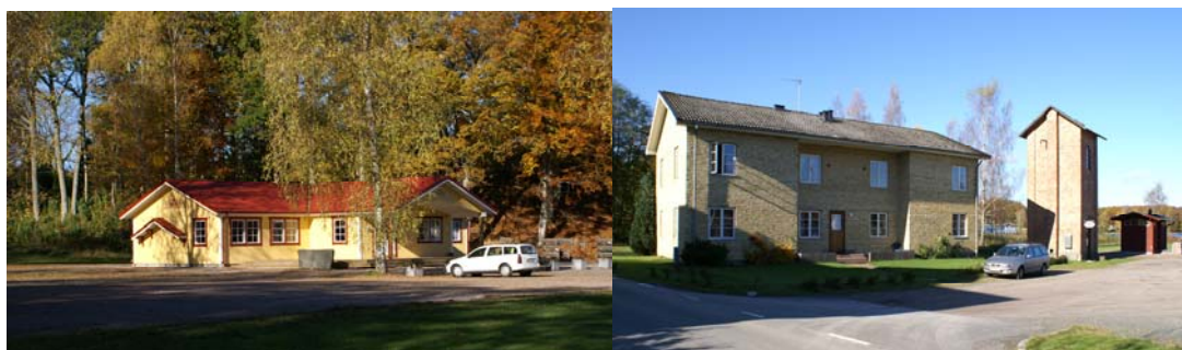
Befintlig bebyggelse med kanotcentrat, flerbostadshuset och det f.d pumphuset numera stenmuseum

Gyviks gamla bytomt, RAÄ 120 i Hjarsås socken, berör planområdets mellersta del med området kring Vinkelvägen. Samtliga markingrepp eller markförändrande åtgärder inom eller inom ett avstånd på 50 m från lämningen kräver länsstyrelsens tillstånd. Utifrån erfarenheter från tidigare undersökningar kan den strandnära miljön med stor sannolikhet inrymma lämningar från stenåldersjägare. Inför framtida byggnads- och anläggningsarbeten föreslås därför en inventering komma till stånd med syfte att fastställa om arbetsinsatserna kommer att beröra fornlämningar inom området och i förekommande fall också föreslå åtgärder för att minimera ingreppen.