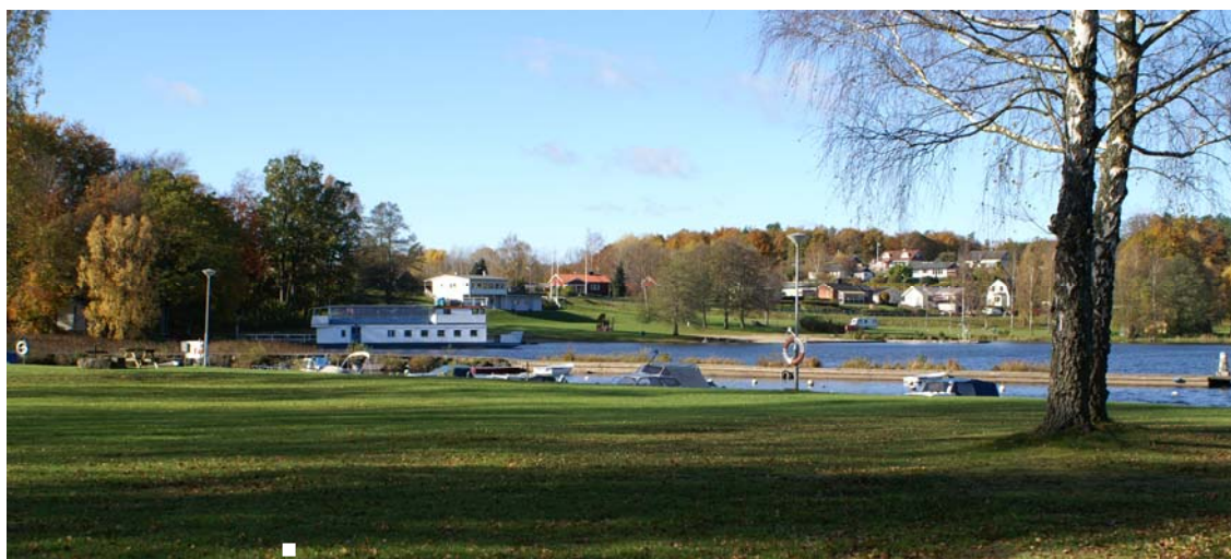
Vy över hamnen med Immelnbåten och badplatsen i bakgrunden

ÖGRAB svarar för sophantering i Immelns samhälle. Kommunen arbetar med att införa källsortering av hushållsavfall.