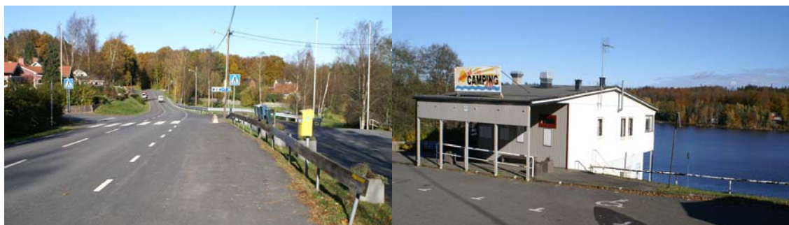
Väg 2056/Immelnvägen i anslutning till kioskbyggnaden och nuvarande badplatsen

Föreslagen markanvändning med komplettering av ytterligare bostäder bedöms generera ca 40 fordon/dygn. Den något ökade trafiken på Gamla Byvägens västra del med anledning härav är inte större än att den bör kunna accepteras. Verksamheterna inom friluftsområdet är starkt säsongsanknutna till sommarhalvåret. Föreslagen strukturering och avgränsning av friluftsområdets olika verksamheter bedöms dock inte medföra några sådana ökade störningar i förhållande till pågående verksamheter att de inte skulle kunna accepteras.