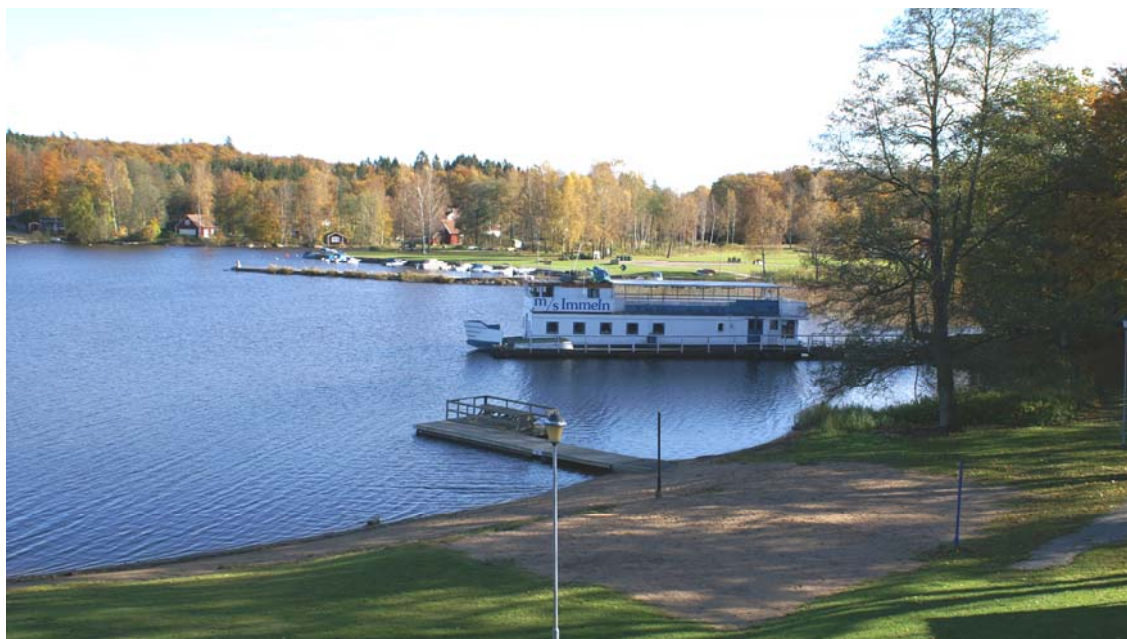
Immelnbåtens nuvarande angringsplats med hamnen i bakgrunden sedd från kioskbyggnadens terrass

För kollektivtrafiken i Immeln innebär planförslaget ingen förändring.