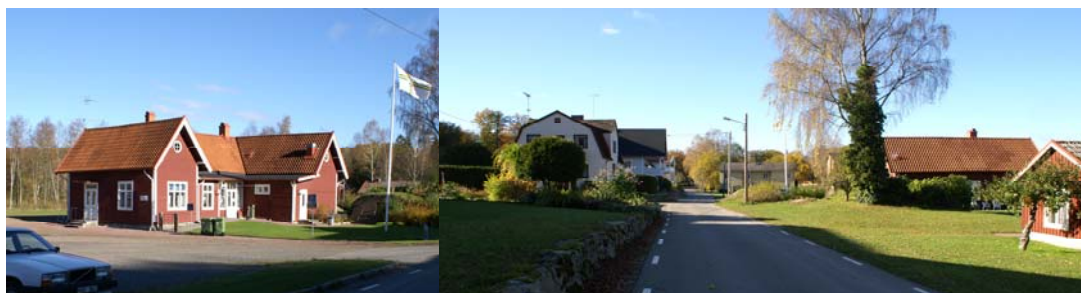
Befintlig bebyggelse med f.d. stationsbyggnaden, numera vandrarhem och vy längs Gamla Byvägen