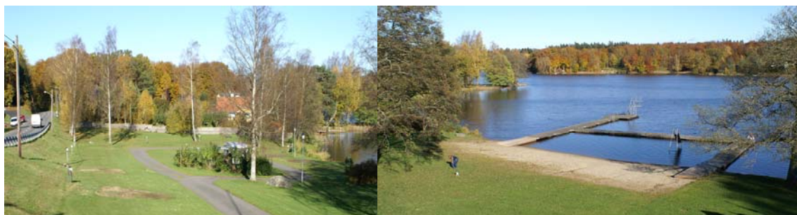
Campingområdet i norr och badplatsen

Inom friluftsområdet föreslås markanvändningen preciseras för respektive område. Det större friluftsområdet, som innehåller strand och aktivitetsområden, där de senare anordnas som gräsytor med intensiv och extensiv skötsel beroende på hur de nyttjas. Badplatsen bibehåller i princip sin nuvarande avgränsning gentemot Immelnbåten i söder. För befintligt campingområde i norr ges användningssätt som medger både camping och stugor medan det i söder vid vandrarhemmet enbart medger stugor. Campingområdenas byggrätt begränsas till 150 m 2 i norr respektive 300 m 2 i söder, vilket möjliggör uppförande av ca 10 och 20 stugor inom respektive område. Tillkommande stugor föreslås ges sjöbodsliknande karaktär. De båda campingområdena upptar en areal av ca 2.500 m 2 vardera. Vandrarhemmet i den gamla stationen läggs ut med användning som vandrarhem. Möjlighet till kompletterande bebyggelse med övernattningsstugor finns också.