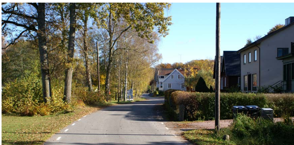
Gamla Byvägen sedd västerifrån

Med hänsyn till trafiksäkerheten utmed väg 2056/Immelnvägen föreslås särskild bestämmelse om förbud mot körbar utfart över kvartersgräns. För kiosken här innebär förslaget att den södra utfarten slopas och samordnas till en enda punkt gemensam med tillfarten till stug- och campingområdet norr därom.