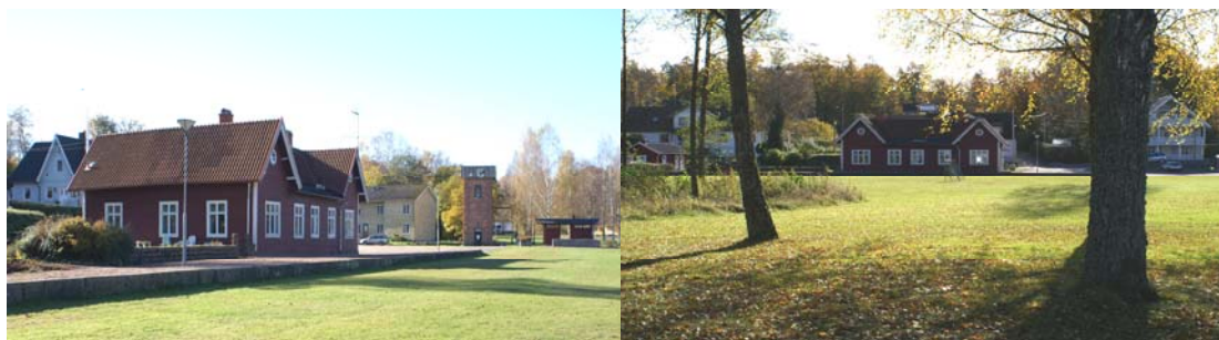
Gamla stationshuset numera vandrarhem

antagna nationella målen för handikappolitiken utformas så att besökande i alla åldrar och med skilda fysiska förutsättningar kan använda dem.