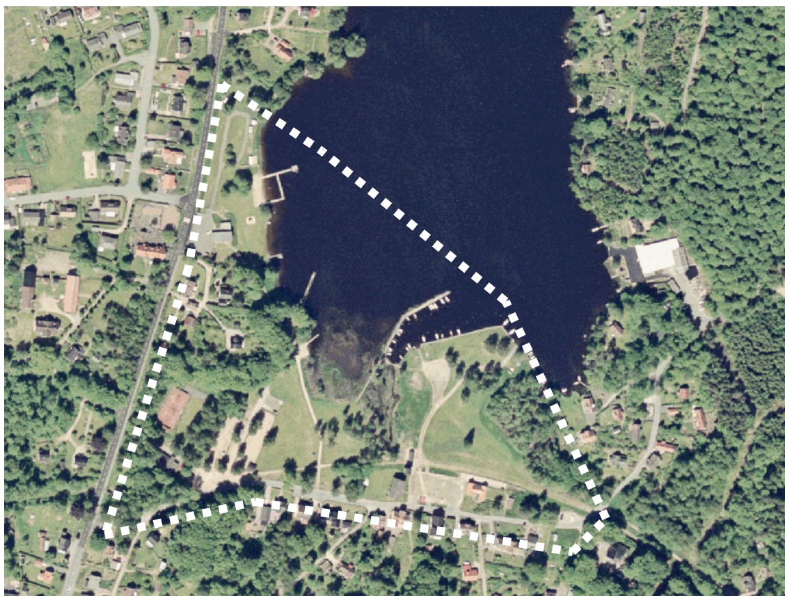
Flygfoto med planområdet ungefärliga avgränsning

Befintlig bebyggelse i anslutning till området utgöres av friliggande enbostadshus i 1- och 2-plan. Strax öster om planområdet finns också Wilh. Rudberg AB:s anläggning för tillverkning av pumpar. Anläggningen är en sk C-anläggning, dvs anmälningspliktig verksamhet.