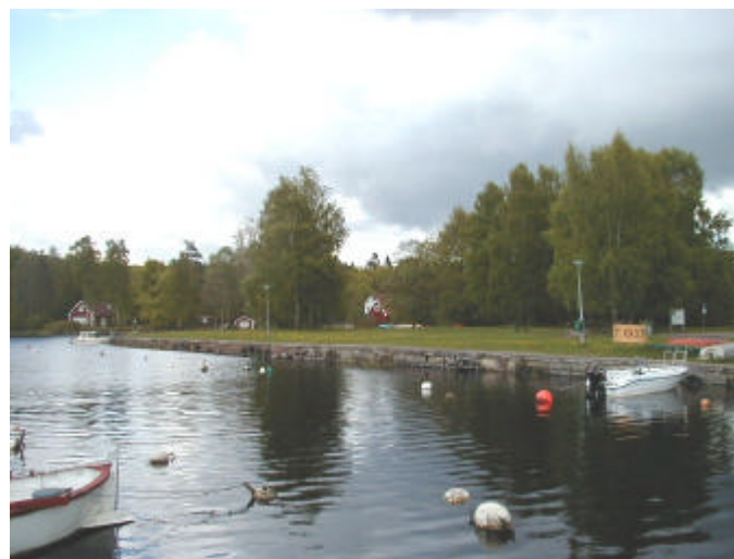
Bild 2 Båthamnen