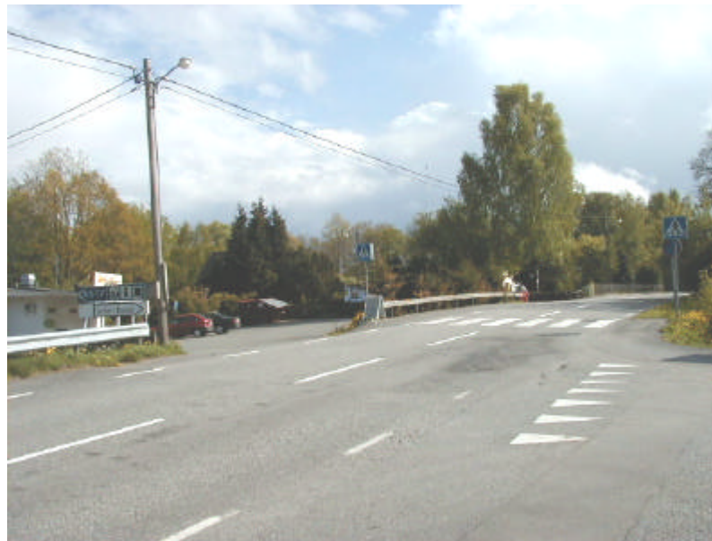
Bild 4 Immelns väg korsningen vid kiosken

Vägverket är väghållare för den allmänna vägen, Immelvägen, väg 2056. Vägen är ca 5,5 m bred och är inom Immelns samhälle försedd med en trottoar på vägens östra sida. Vägen går parallellt med sjön Immeln mellan väg 2101 och 2051.