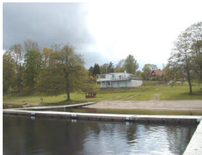
Bild 1 Kiosken

Kommunledningskontoret Miljö- och byggavd. Storgatan 4 280 60 Broby