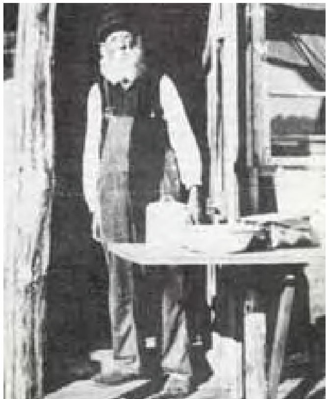
Fula-Månsen i Immeln

"Han var en stigman i livet, en trapper, och som en trapper ville han dö. Han fick sin önskan uppfylld, att få dö som en fri man vid Immelns strand"