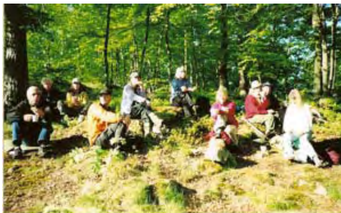
På gökotta vid sjön, i solsken bland nyutslagna bokar.

Söndagen den 22 maj träffas vi vid Vandrarhemmet kl.7.00 på morgonen för att tillsammans vandra en liten bit till ett skönt ställe där vi kan njuta av naturen, lyssna till göken, äta vår medhavda frukost och ha det trevligt tillsammans. Så ställ väckarklockan och ge dig ut i våren! Vi ses!